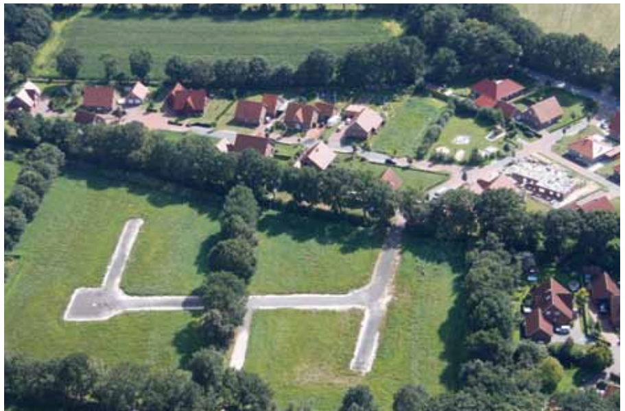
Das Neubaugebiet erfreut sich großer Beliebtheit. Nur noch sechs der 15 Bauplätze sind noch zu haben.

Der alte Friedhof (an der Hollener Landstraße) erhält ein neues Tor . Das jetzige aus weiß lackiertem Holz ist „abgängig“ und wird durch eins aus verzinktem Eisen ersetzt, ähnlich wie das auf der gegenüber liegenden Seite am Ehrenmal.