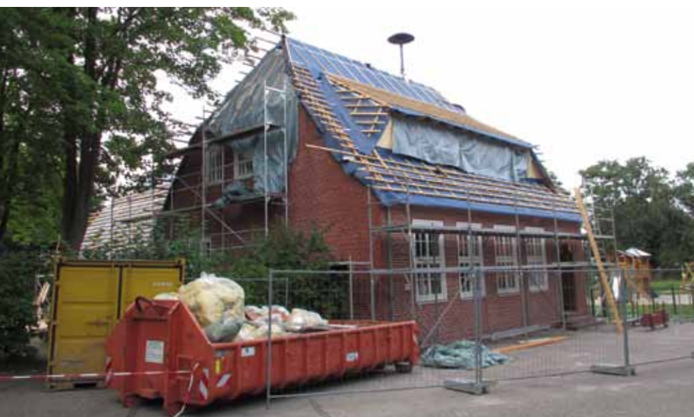
Die alte Schule hat ein neues Dach erhalten.

Beim Spielplatz Am Bargacker wurde der bisherige Hauptzugang zur Sicherheit der Kinder mit einem kleinen Sandwall geschlossen . Da demnächst mit vermehrten (Bau-)Verkehr zum neuen Bauabschnitt gerechnet werden muss, sollten die Kleinen den seitlichen Zugang benutzen.