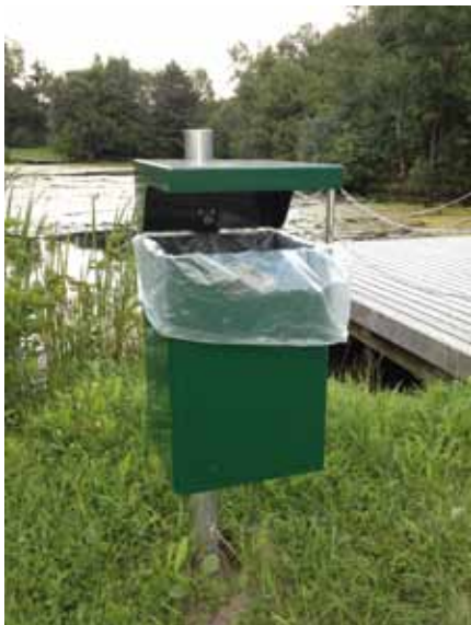
Die zusätzlichen Abfallgefäße sollen für mehr Sauberkeit sorgen.

oder auch Noteinsatzfahrzeuge kommen dann einfach nicht mehr durch.