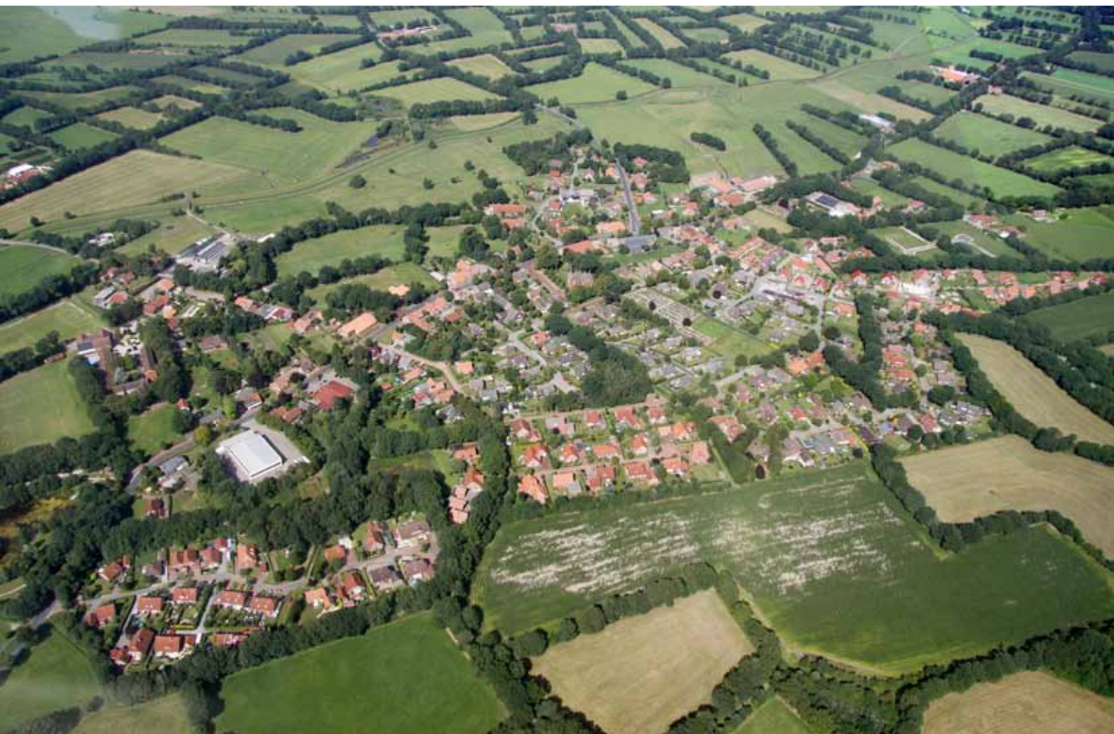
Hollen aus der Vogelperspektive. Das Foto entstand am 18. August 2012.

Wer hat Ideen? Wer hat Lust, bei der Planung mitzumachen? Das Orga-Team, das bis jetzt hauptsächlich aus den Vereinen besteht, trifft sich am Donnerstag, 27. September, um 20 Uhr im Gasthof „Zur Post“ . Wer also Lust hat, ist herzlich eingeladen, dazu zu kommen.